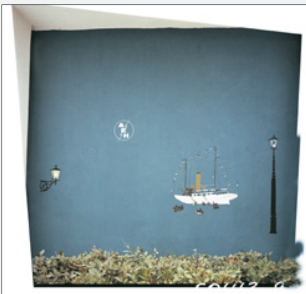
Σπύρος Βασιλείου (1902 ή 1903 - 1985), Σύνθεση με καράβι, ΔΕΘ 1965 Περίπτερο ΔΕΗ