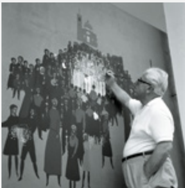
Ο Σπύρος Βασιλείου (1902 ή 1903 - 1985) σε στιγμές δημιουργίας στο περίπτερο της ΔΕΗ το 1965